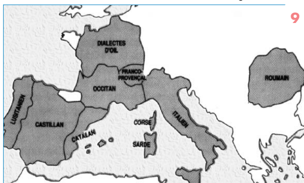
Latinaren banaketa dialektala. Euskara hizkuntza erromanikoz inguratutik.