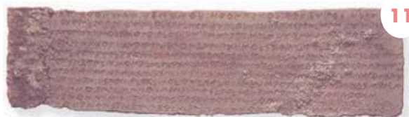
Botorritako brontzea. Iberierazko idazkera.