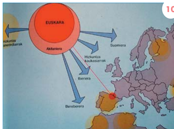
Iturria: Euskara, euskaldunen hizkuntza.