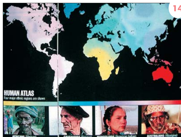
Munduko arraza nagusiak. Kaukasikoen prototipo edo eredu gisa, euskaldunak.