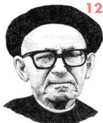
Iturria: Orbitepan. Xamar. Pamiela, 1992