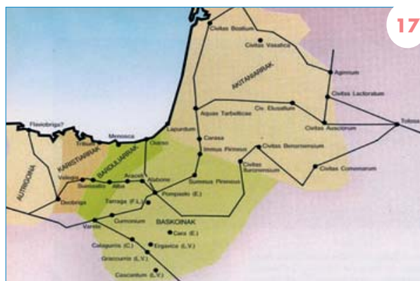
Iturria: Euskara, euskaldunen bizkuntza.

Euskaldunen berri ematen lehena Tito Libio erromatarra izan zen, K.a. 76. urtean. Ordutik aurrera ugari dira euskaldunei buruzko aipamenak erromatarren agirietan. Euskal Herrian erromatarrek Ager Vasconum eta Saltus Vasconum bereizten zituzten. Ager Vasconum lautada zen batez ere, Ebro eta Aturri ibai nagusien inguruak; eremu horretan kokatu ziren. Saltus Vasconum (lurralde menditsua) ez zen interesgarria erromatarrentzat, nekazaritzarako ez baitzuen aberastasunik.